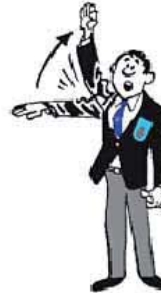
Waza-ari awasete Ippon