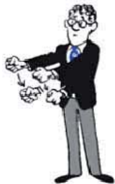
Falsche Attacke (Scheinangriff)