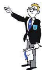
Siegereverkündung (nach Hantei )