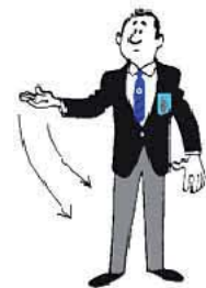
Den Arzt auf die Matte rufen