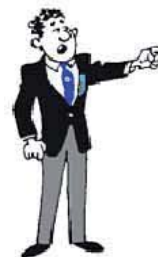
Eine Strafe verhängen