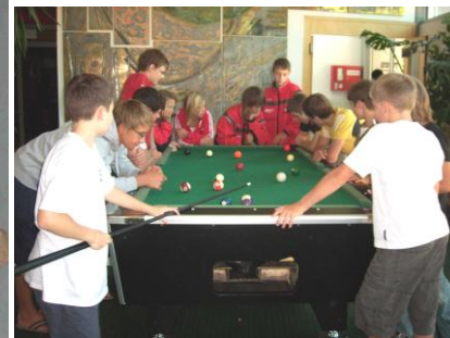
Bilder vom Trainingscamp Tschagguns

Anreise: Wer mit der Bahn anreist, muss in Bludenz in die Montafonerbahn Bludenz-Schruns umsteigen. Mit der Montafonerbahn fährt ihr bis zum Bahnhof Tschagguns . Dort werdet ihr um ca. 15 und 17 Uhr mit dem Sportschulbus abgeholt. Kommt jemand zu einem anderen Zeitpunkt dort an, so kann er sich unter der Tel.: 05556/76176-0 in der Sportschule melden.